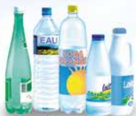
Bouteilles d'eau, de jus de fruit, de soda, de lait, de soupe...