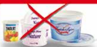
Pots de produits laitiers

Non recyclables, à jeter dans votre poubelle habituelle