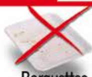
Barquettes en polystyrène