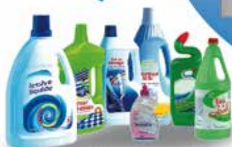
Flacons de produits ménagers...