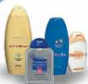
Flacons de produits de toilette...

Non recyclables, à jeter dans votre poubelle habituelle