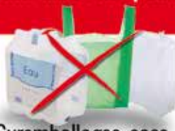
Suremballages, sacs, films en plastique