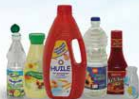
Bouteilles d'huiles alimentaires